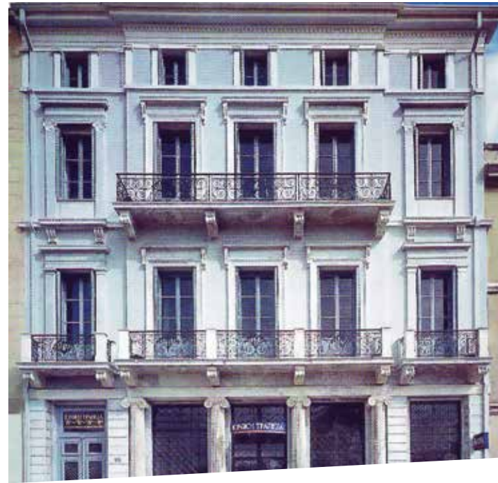
Κατάστημα Πατρών