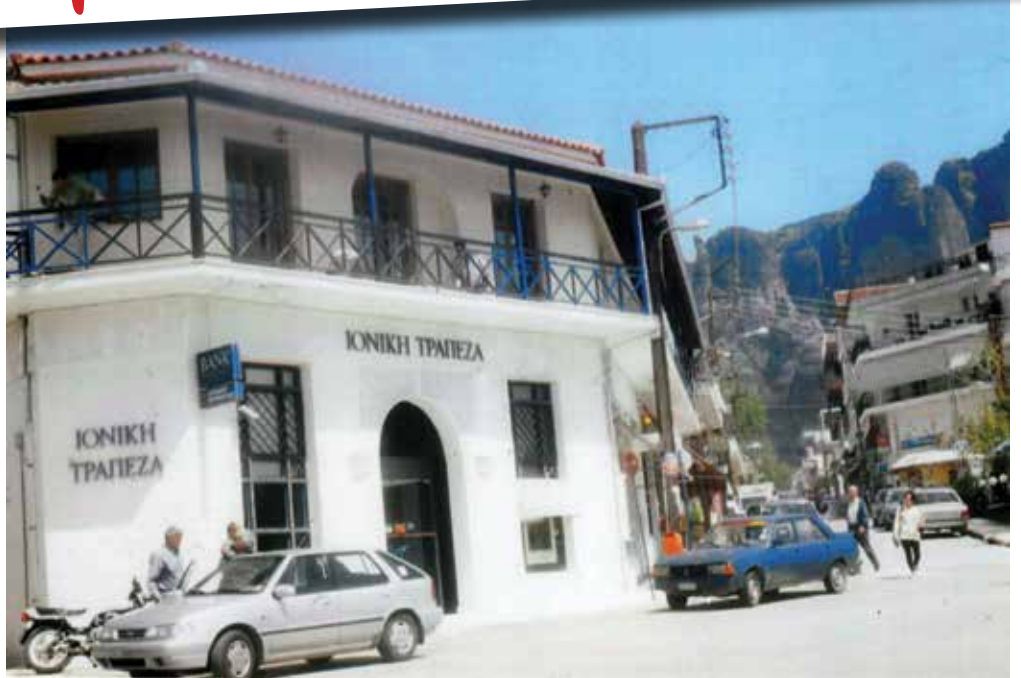
Κατάστημα Καλαμπάκας -1999-Φωτογραφικό Αρχείο Τακη Μαρούλη.