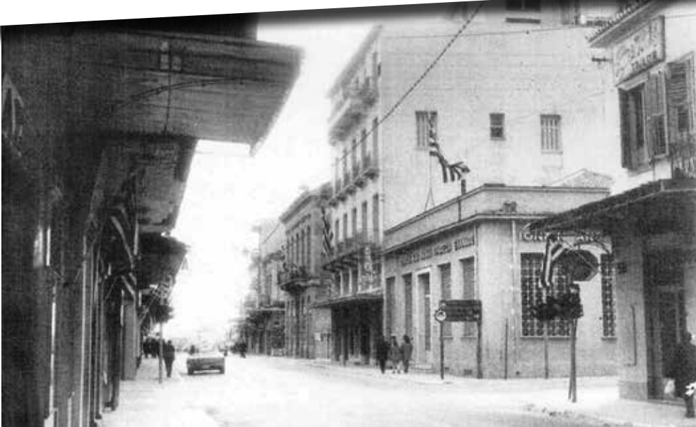
Κατάστημα Καλαμάτας - Φωτογραφικό Αρχείο Μεσσηνιακού Τύπου.