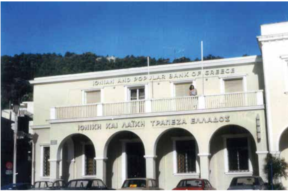
Κατάστημα Ζακύνθου -1983-Φωτογραφικό Αρχείο Τάκη Μαρούλη.