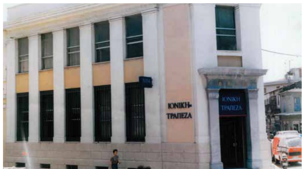
-Κατάστημα Χίου - 1991-Φωτογραφικό Αρχείο Δημήτρη Βασιλάκη.