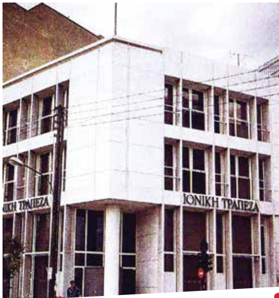
Κατάστημα Λάρισας